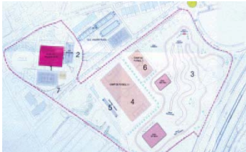
Projecte provisional de la zona esportiva mancomunada als voltants del pavelló. A la dreta, signatura de l'acord entre els alcaldes de Premià de Dalt i Premià de Mar

Els acords assolits entre els dos Premià inclouen, com a primera actuació, la construcció d'una pista de skate -el projecte de la qual es va presentar a començaments d'abril- i un equipament per a les bicicletes tot terreny (BTT) als espais que hi ha just al costat del pavelló poliesportiu de Premià de Dalt. A més, als terrenys de Can Vilar -per sobre del camí del Mig, a escassos metres del pavelló