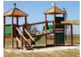
Mostra dels nous jocs