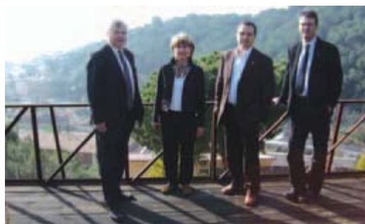
Representants de La Caixa a la Cadira del Bisbe

Representants de la Fundació La Caixa van signar, el passat 7 d'abril, el conveni de col·laboració amb l'Ajuntament, mitjançant el qual la Fundació aporta prop de 12000 euros per a l'arranjament dels jardins arqueològics de la Cadira del Bisbe. D'altra banda, a finals de març es van presentar a l'oficina de La Caixa de Premià de Dalt les dues noves targetes de crèdit