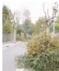
Poda d'arbres a la Riera

era totalment necessària per garantir la seva bona salut. Els treballs van iniciar-se a la Riera i, lògicament, han provocat algunes modificacions puntuals en la circulació. Mentre han