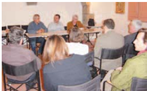
Acte de signatura del conveni amb el col·lectiu 'L'Opinió'

col·lectiu L'Opinió cedeix la capçalera a l'Ajuntament de Premià de Dalt per a l'edició de la nova època de la revista municipal, el primer número de la qual va aparèixer el mes d'octubre.