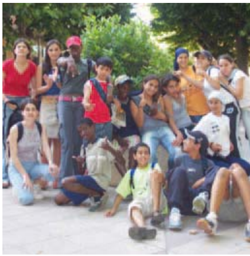
L'objectiu és millorar l'èxit escolar dels joves de Premià de Dalt